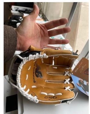
グローブが届きました