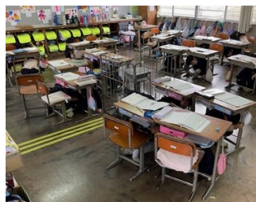
机の下に避難しています