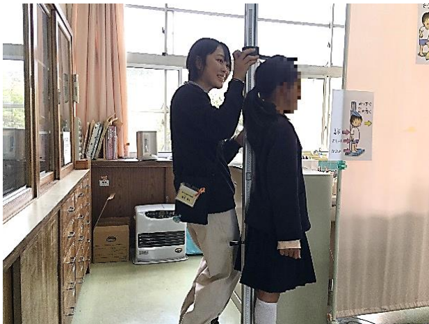
養護教諭が身長を計測しています。

学校では子どもたちが毎日健康で元気に過ごせるように、様々な健康診断が定期的に行われます。1学期には、視力や聴力、尿検査や内科・歯科の検診、身長や体重の測定などがあり、自分の体のことを知る良い機会です。お子さんが体と心の健康を大切にしてお過ごせるように、保護者の皆様と一緒に考えていきたいと思ひます。