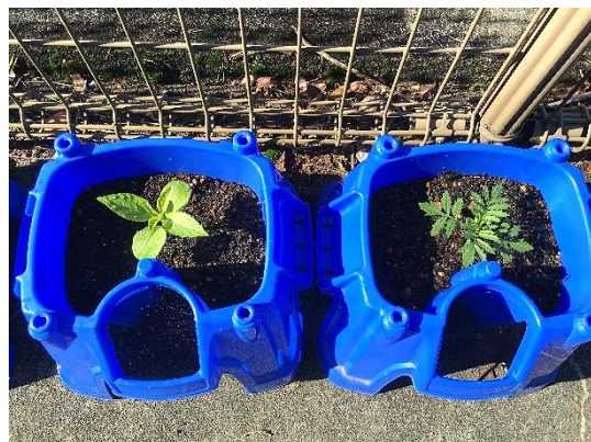
ホウセンカ(左)と マリーゴールド(右)(3年)