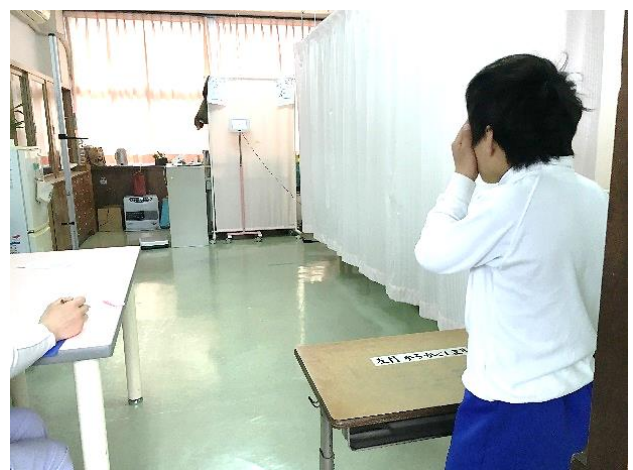
ただいま、視力を検査中！