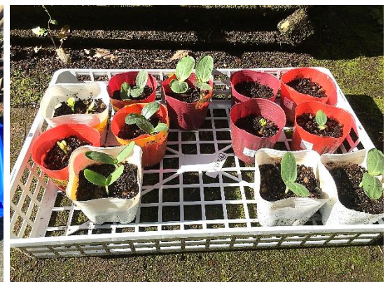
ヘチマとヒョウタン(4年)