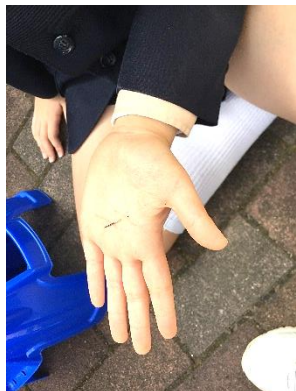
マリーゴールドの種

生活科や理科の学習で、植物が季節とともにどのように成長していくのか観察をしています。2年生はトマトやキュウリなどの苗を植木鉢や小さな畑に植えました。3年生は、ホウセンカとマリーゴールド、4年生は、ヒョウタンとヘチマの種をまいて観察をしています。4月中旬に種をまいた植物がようやく芽を出しました。発芽は気温や天候の影響を受けるので、個体によって(種をまいてから)発芽するまでの期間は様々です。天候、土壌、環境等、自然の営みは正直です。子どもたちは、日に日に移り変わる自然の営みに目を向け、人と自然が響き合う素晴らしさを、植物の観察を通して感じていくのではないのでしょうか。