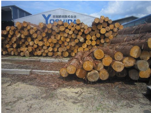
仕入(しい)れた木材

安倍校区にはたくさんの木材工場があります。製材所では、一本の木を、皮をむくところから仕上げまで行っているところもあります。皮(かわ)をむく機械(きかい)や木を切る機械など、大きな機械がいくつもあります。一本の木を大切に使うために、皮は肥料(ひりょう)、切った時に出る木の粉(こな)は燃料(ねんりょう)に変(か)えるなど、無駄(むだ)にならないようにしています。