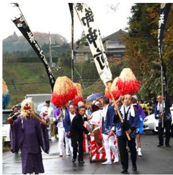
左 大柳生の太鼓踊り 右 都祁村の太鼓踊り