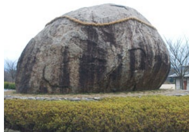
左 右 柳生 山添村の長寿岩 の 一刀石