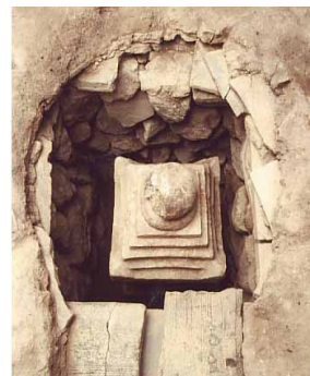
本堂の下から 発見された石塔