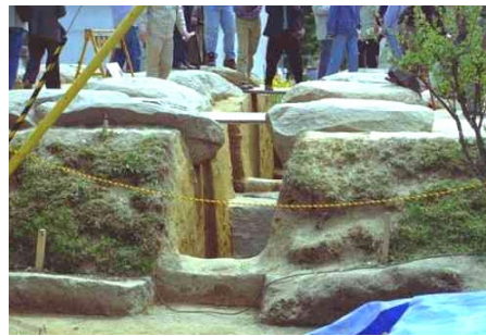
発掘された 塔基壇の 巨大心礎