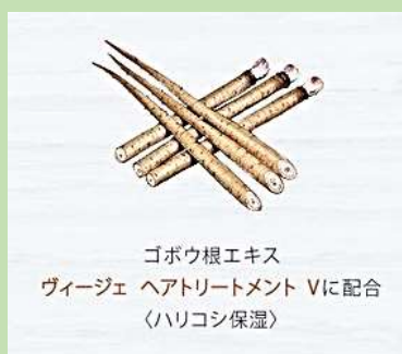
ゴボウ根エキス ヴィージェ ヘアトリートメント Vに配合 〈ハリコシ保湿〉

アスパラギン酸はタンパク質を助けて 新陳代謝を活発 高い美肌効果が期待されます。