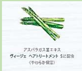
アスパラガス茎エキス ヴィージェ ヘアトリートメント Sに配合 〈やわらか保湿〉

アスパラギン酸はタンパク質を助けて 新陳代謝を活発 高い美肌効果が期待されます。