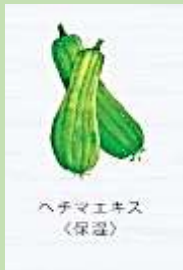
ヘチマエキス 〈保湿〉