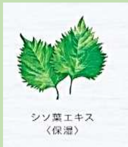
シソ葉エキス 〈保湿〉