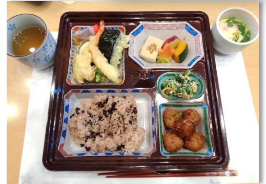
(赤飯・天ぷら・炊き合わせ・茶碗蒸し)