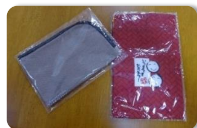
マスクケースと巾着