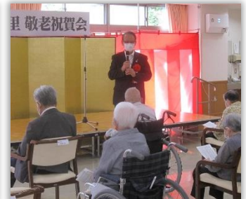
南丹市長 西村 良平 様