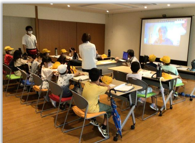
～オアシス多目的室にて～

短い時間でしたが、元気いっぱいの子供達と一緒に勉強が出来て楽しかったです。また、機会があれば施設に足を運んでください。