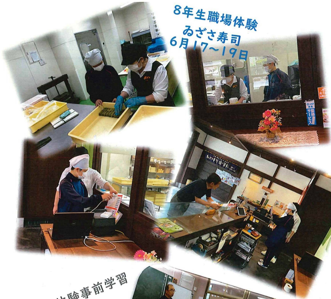
8年生職場体験 みざさ寿司 6月17~19日