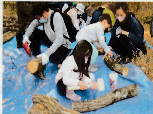
▲ 椎茸原木の作成の様子

今後は各種イベント（七草狩り、筍堀、田植・稲刈、芋掘等）を開催しながら、地域に貢献していきたいと思ひます。