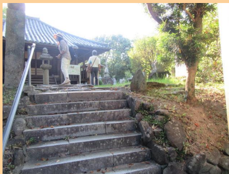
往生院(おうじょういん)