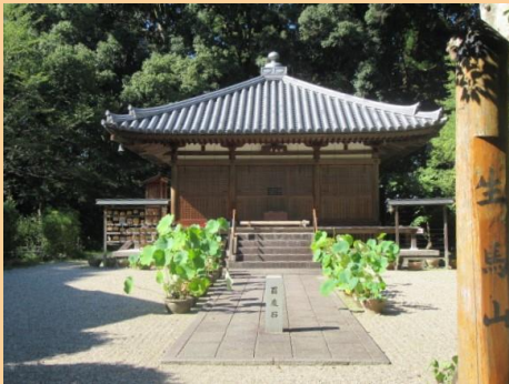
竹林寺(ちくりんじ)