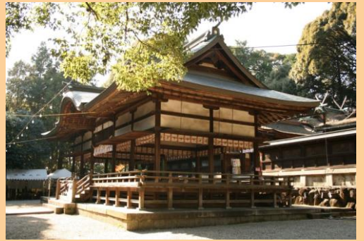
往馬大社(いこまたいしゃ)・拝殿