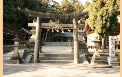
往馬大社(いこまたいしゃ)・鳥居