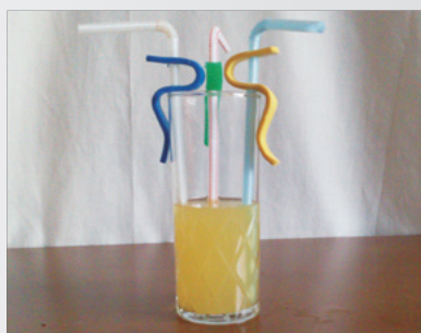
ストローホルダー