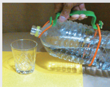
2L ペットボトルハンドル