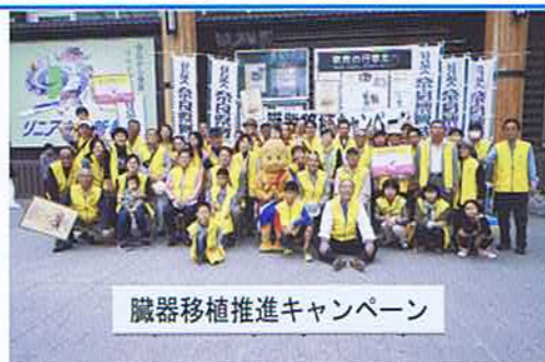
臓器移植推進キャンペーン

毎年10月第1日曜日には全国一斉に臓器移植推進キャンペーンが行われます。県内でも奈良県のマスコット「せんとくん」をデザインしたドナーカードなどを街頭で配布し、臓器移植および臓器提供の普及活動に努めています。