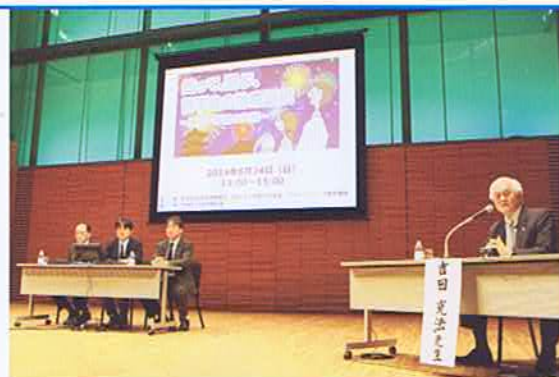
県民公開講座の様子

県民公開講座を開催し、透析患者をこれ以上増やさないために糖尿病撲滅運動や腎臓病の予防啓発運動を進めていきます。