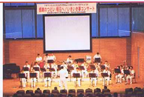
40周年記念コンサート

最新の透析医療や災害時の透析体制、食事管理など透析生活に欠かすことの出来ない医療・福祉について医師・介護スタッフの方々を講師に招いて学習しています。