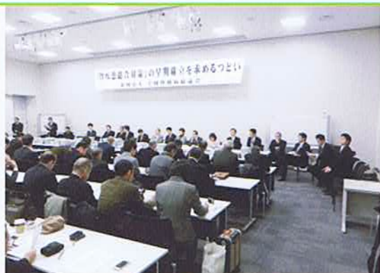
国会請願集会の様子

毎年、全腎協と共に「腎疾患総合対策」の確立を求め、100万筆を超える署名を国会に提出しています。県内においても会員の協力により、1万筆以上の署名を集めて代表者が上京し請願集会に参加します。