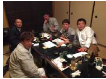
奈良支部会の様子

さて、先日11/2(月)PM6:00<秋田屋>天理市で奈良支部会を開催致しました。支部長のお話から始まりその後は仕事の話や雑談でいつものように盛り上がりました。決め事があったのですが、出席者が少なく保留となりました。後日、来年1月にはもう一度、奈良支部新年会を開催する事となりました。多数のご出席を期待しております。