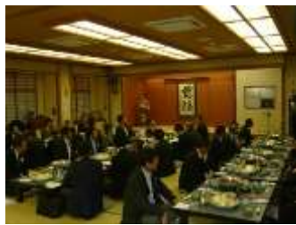
忘年会全体の様子

鉄構組合では、賛助会員さんと合同の事業をより増やしていく事で、業界の団結を高めてファブの地位向上を目指しています。これからもたくさんの方の参加を期待しておりますので、少しの時間でいいので顔を出してください。