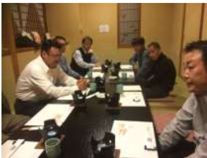
高田支部会の様子

ところで、最近のTVで「♪ブーツブーツブーツブーツ テレーーッテッテッテレー」と結果にコミットするCMをよく見かけます。自分も50才を迎え、お腹の肉廻りがみっともなくついている事に気がつき、「なんとかせねば」と生涯初めてのダイエットと一念発起しました。自己流で2ヶ月ほどがんばっていますが、そこそこには成果が出てますが、CMのように劇的とは行きませんね。このならてつが発刊される頃は新春とお屠蘇気分がダイエットには厳しい時期ですが、みなさんも体をご自愛して、暴飲暴食は控えてください。