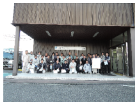
JFE建材にて、デッキPLライン他見学