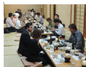
研修会、意見交換会風景