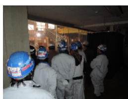
田中亜鉛鍍金見学