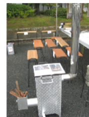
鉢置き、ロケットストーブ（ニシクボ製作所）