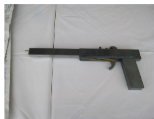
鉄製ゴム鉄砲（フジテツ）