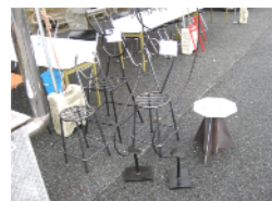
椅子（上柿鉄工建設）