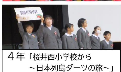
4年「桜井西小学校から ~日本列島ダーツの旅~」