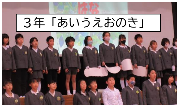
3年「あいうえおのき」