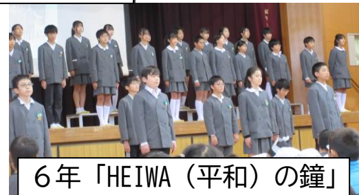
6年「HEIWA (平和) の鐘」