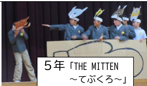
5年「THE MITTEN ~てぶくろ~」