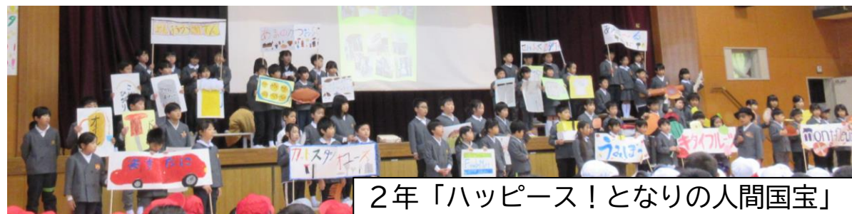
2年「ハッピーズ！となりの人間国宝」