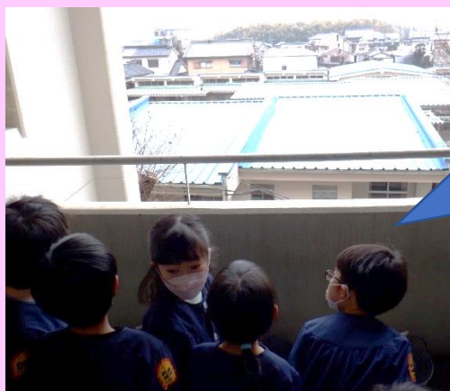
幼稚園の屋根が見えるよ