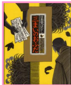
『三まいのおふだ』 おざわとしお/再話 かないだえつこ/絵 くもん出版