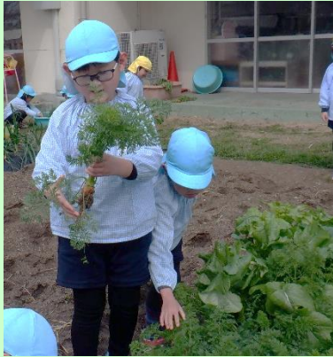
ニンジンとキャベツの収穫