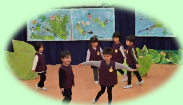
おたまじゃくしの101ちゃん