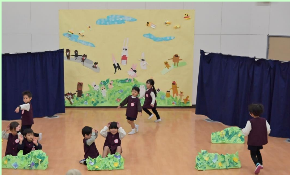
かくれんぼうさぎ

劇遊びをお家の方に見ていただきました。お話の世界で遊び、言葉や身体で表現し、リズムに合わせて動くことを楽しみました。たくさんのお客様に緊張していましたが、クラスのみennaと力を合わせて頑張りました。たくさんの拍手をいただき嬉しそうな子どもたちでした。