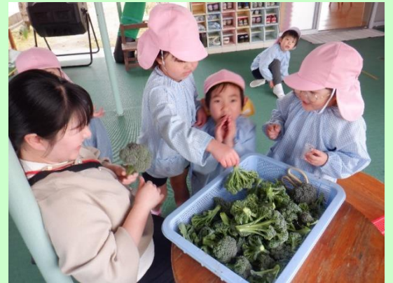
ブロッコリーは、お店で買うものより柔らかくておいしいと評判でした。