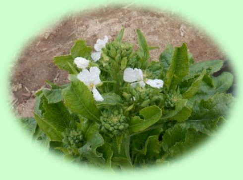
これは何の花かわかりますか？