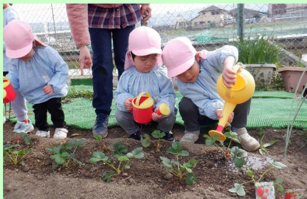
イチゴの苗を植えました。