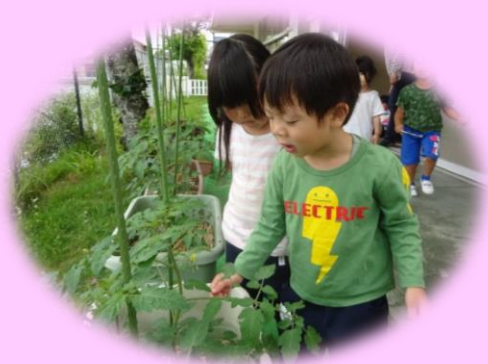
「プチトマト大きくなってきたよ」

筒井地区はレンコンが有名です。地域の方が幼稚園にもレンコンを植えてくださり、子どもたちは継続的に見えています。レンコンの葉に水をかけると、水玉ができゆらゆらと動きます。「見て！きれい!!」「面白いな!」「どうして、こうなるのかな?」とレンコンの葉の不思議に心を躍らせてみえています。