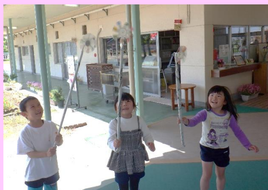
年長児はこいのぼりの風車も作りました。風が吹くととてもよく回りました。