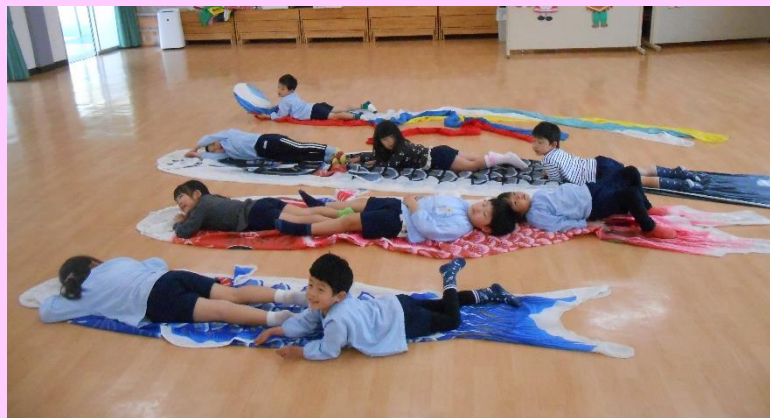
背比べをしました。