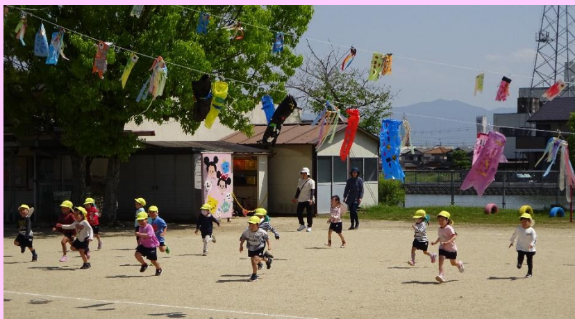
みんなのこいのぼりを園庭にあげました。