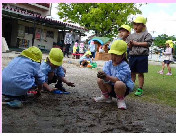
「べちゃべちゃ・ドロドロ だろんこ遊び楽しいよ」