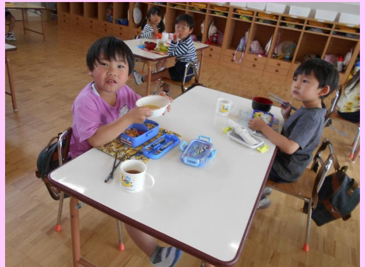
「おいしい！！」「玉ねぎが甘いな」「おかわり！！」みんな嬉しそうでした。