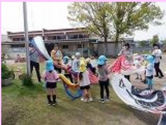
こいのぼりさん、長いな。みんなで持とう！

子どもたちの健やかな成長を願い、こいのぼりをあげました。5月の空に元気に泳ぐこいのぼりを見てとても喜んでいました。各クラスとも、いろいろな素材を使い発達に合わせた自分のこいのぼりを作りました。みんなが作ったこいのぼりは園庭で元気に泳ぎました。