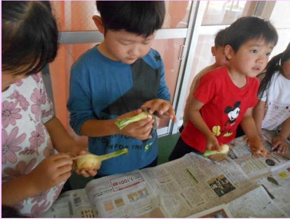
玉ねぎの皮は年長児が剥きました。