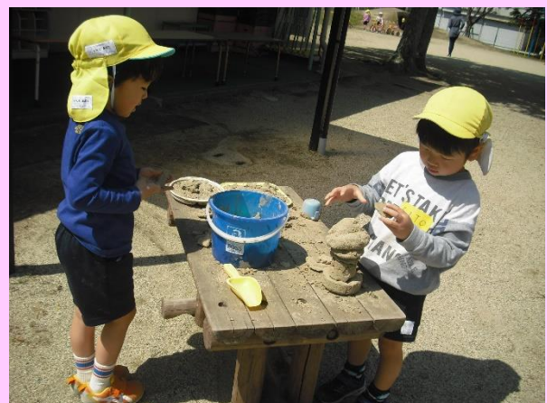
「泥が硬くなっているよ。不思議だな」