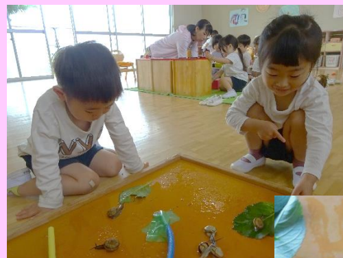
「カタツムリって可愛いな」