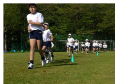
朝の かけ足 (5分間)

「ふるさと吉野」の地域の特色や歴史、文化、生活などについて、いろいろな学習活動を通していろいろな場所や道具、出来事や人々を通じて知ったり、学んだり、考えたりすることから、「ふるさと吉野」を愛し、誇りに思う心情をはぐんでいきます。本校では、吉野山小学校から受け継いだ吉野山の桜を育てる活動を継続して行っています。これも特徴的な取組です。