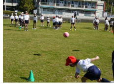
縦 割り ボール パス